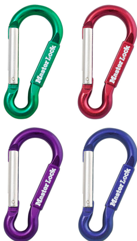
MASTER LOCK MOSQUETON DE METAL SIN TRABA, COLORES VARIADOS