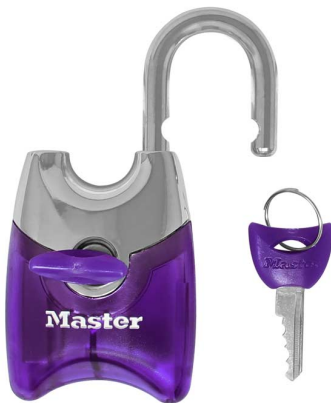
MASTER LOCK CANDADO CON CUERPO DE ZINC FUSION DE 1-3/4" (44 MM) ARCO RECUBIERTO