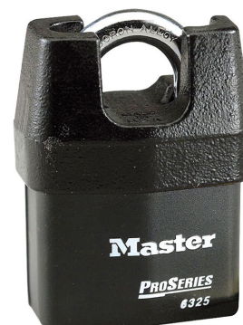
MASTER LOCK CANDADO DE ACERO LAMINADO RECUBIERTO PROSERIES 2-3/8" (60MM)