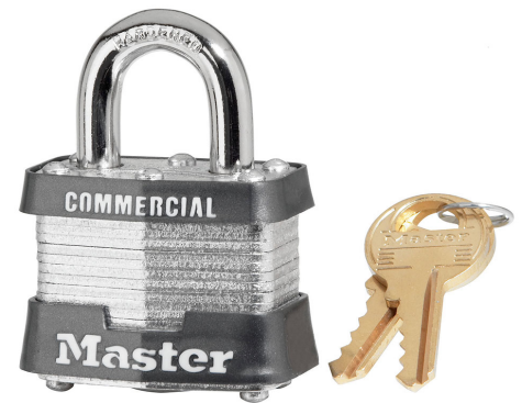
MASTER LOCK CANDADO LAMINADO 1-9/16" (40MM) LLAVES IGUALES