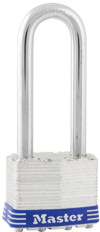
MASTER LOCK CANDADO DE ACERO LAMINADO 1-3/4" (44MM)