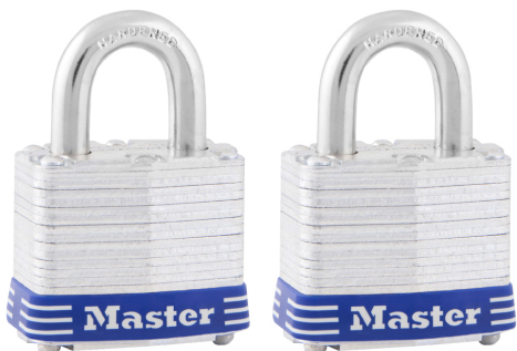
MASTER LOCK CANDADO DE ACERO LAMINADO 1-9/16" (40MM) (2PC)