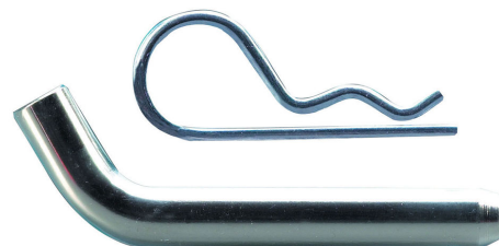
MASTER LOCK PASADOR DEL RECEPTOR 5/8" (16MM)