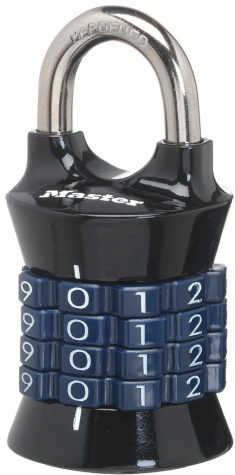
MASTER LOCK CERRADURA DE COMBINACION MULTICOLOR 1-1/2 PULG. (38 MM)