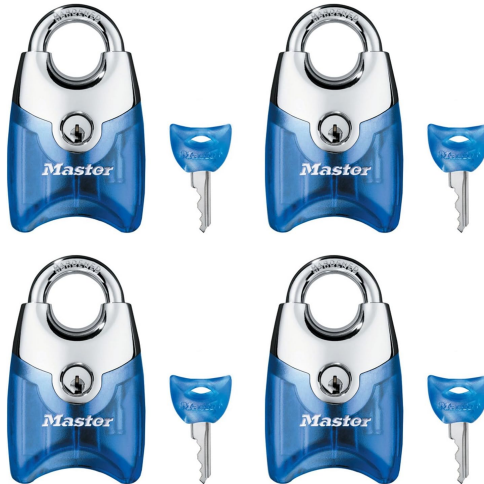
MASTER LOCK CANDADO 3/4 (19MM) (4 PCS) SURTIDO