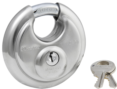
MASTER LOCK CANDADO DE DISCO DE ACERO INOXIDABLE 2-3/4" (70MM)