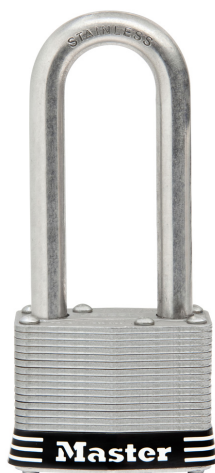
MASTER LOCK CANDADO DE ACERO INOXIDABLE LAMINADO DE 2" (51MM) X 2-1/2" (64MM)