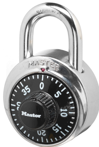
MASTER LOCK CERRADURA DE COMBINACION 1-7/8"