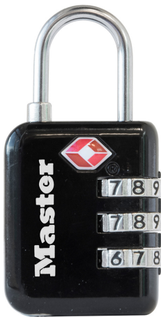
MASTER LOCK CANDADO PARA EQUIPAJE TSA 1-3/16" (30MM) NEGRO