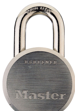
MASTER LOCK CANDADO DE ACERO MACIZO DE 2-1/2" (64MM)