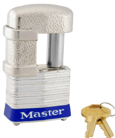
MASTER LOCK CANDADO 1-9/16" LAMINADO (40MM)