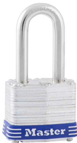
MASTER LOCK CANDADO DE ACERO LAMINADO 1-9/16" (40MM)