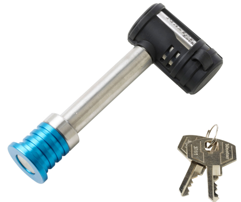
MASTER LOCK CERRADURA DEL RECEPTOR BARBELL DE ACERO INOXIDABLE 5/8"