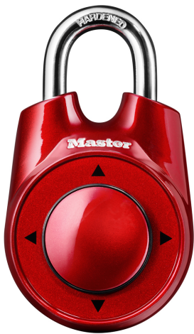
MASTER LOCK CANDADO DE COMBINACION SPEED DIAL 2-1/8" MULTICOLOR