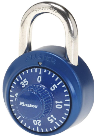
MASTER LOCK CERRADURA DE COMBINACION MULTICOLOR 1-7/8" (48 MM)