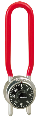
MASTER LOCK CERRADURA DE COMBINACION CON GRILLETE 1-7/8 (48MM)