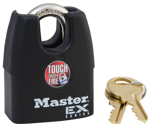
MASTER LOCK CANDADO CON ARCO CUBERTO 1-9/16" (40MM)