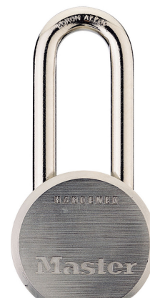
MASTER LOCK CANDADO DE ACERO SOLIDO MACIZO DE 2-1/2" (64MM)