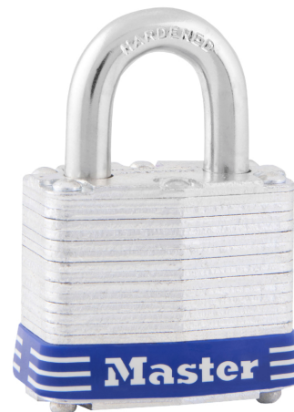
MASTER LOCK CANDADO LAMINADO PADLOCK 40MM