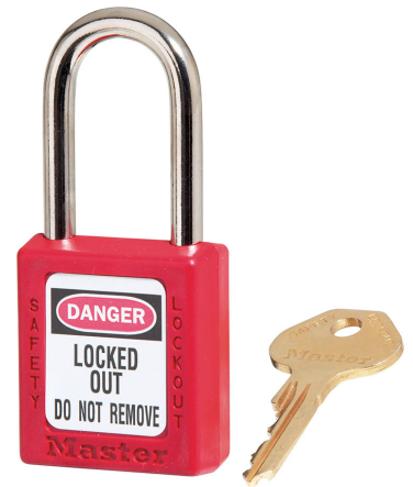
MASTER LOCK CANDADO DE SEGURIDAD ZENEX EN TERMOPLASTICO ROJO 1-1/2" (38MM)