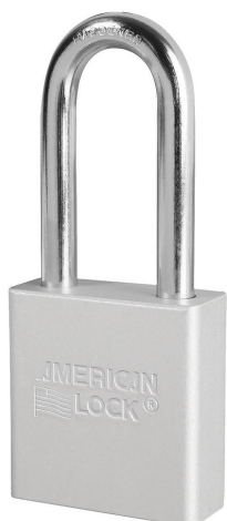
AMERICAN LOCK CANDADO CON 2 LLAVES 1-3/4" (44MM)