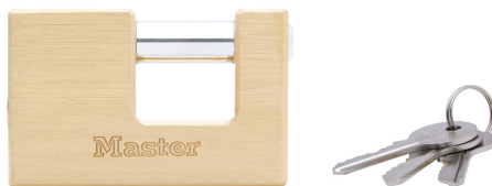
MASTER LOCK CANDADO DE CUERPO SOLIDO DE ZINC 2-15/16" (75MM)