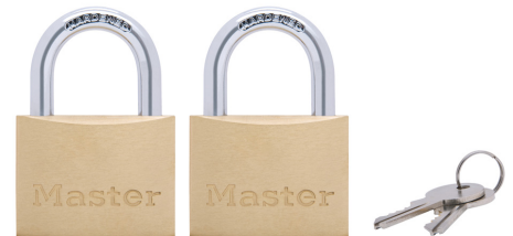
MASTER LOCK CANDADO DE CUERPO SOLIDO DE LATON DE 2" (51 MM), (PAQUETE DE 2)