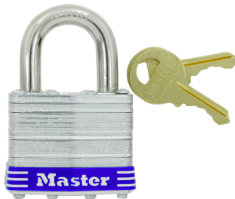
MASTER LOCK CANDADO DE ACERO LAMINADO DE 1-3/4" (44 MM)