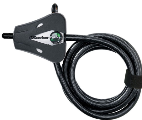
MASTER LOCK CABLE AJUSTABLE 6FT (1.8M)