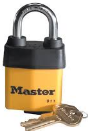
MASTER LOCK CANDADO DE ACERO LAMINADO RECUBIERTO DE 2-1/8" (38MM)