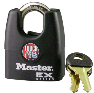
MASTER LOCK CANDADO DE ACERO LAMINADO RECUBIERTO 1-3/4" (44 MM)