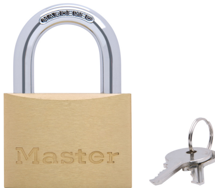
MASTER LOCK CANDADO CON CUERPO MACIZO DE LATON, 2-3/8" (60 MM)