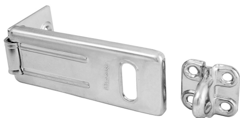
MASTER LOCK ALDABA DE ACERO ENDURECIDO 3-1/2" (89 MM)