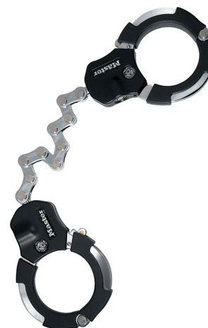
MASTER LOCK CANDADO STREET CUFFS 3"