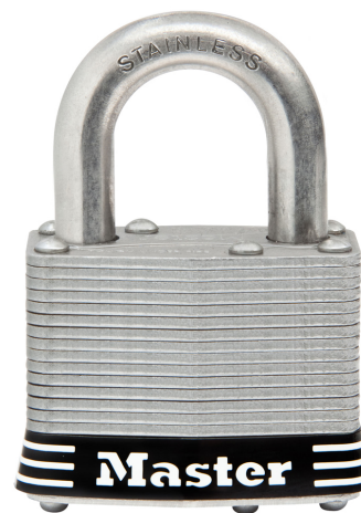
MASTER LOCK CANDADO LAMINADO 2" (51MM)