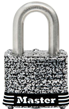
MASTER LOCK CANDADO DE ACERO INOXIDABLE LAMINADO 1-9/16" (40MM)